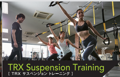
TRX Suspension Training 【TRX サスペンション トレーニング】