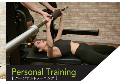
Personal Training 【パーソナルトレーニング】