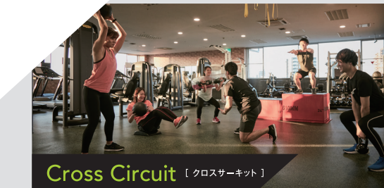
Cross Circuit 【クロスサーキット】