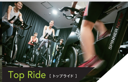
Top Ride 【トップライド】