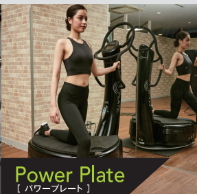
Power Plate 【パワープレート】