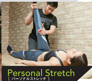
Personal Stretch 【パーソナルストレッチ】